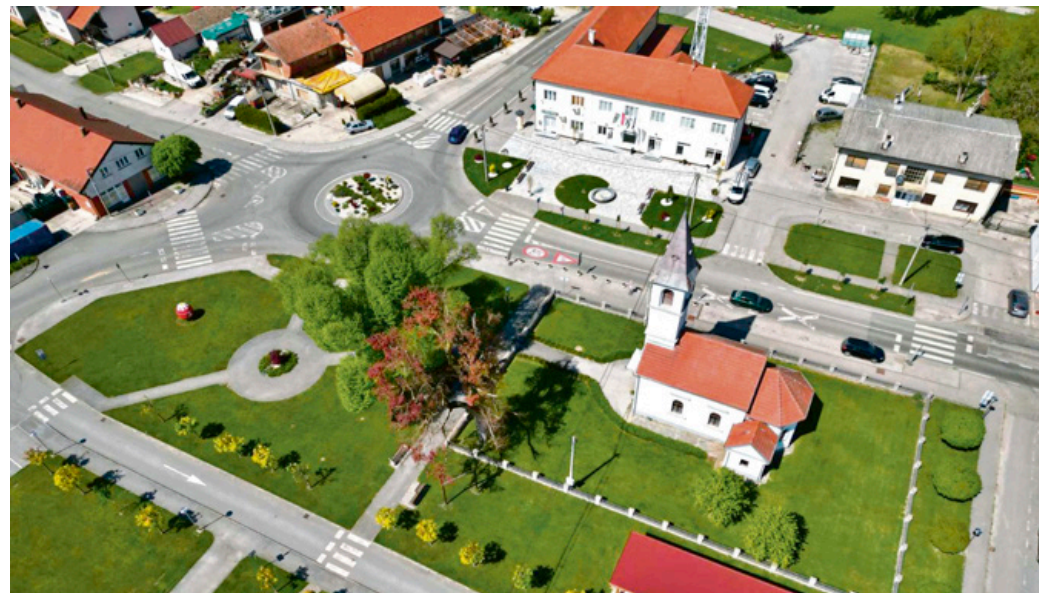
PROGRAM PREKOGRANIČNE SURADNJE IZMEĐU REPUBLIKE HRVATSKE I BOSNE I HERCEGOVINE NOSITELJ PROJEKTA: OPĆINA FARKAŠEVAC