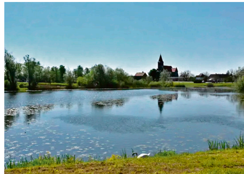
NACIONALNI PLAN OPORAVKA I OTPORNOSTI NOSITELJ PROJEKTA: OPĆINA ORLE

Razvojna agencija Zagrebačke županije Ulica grada Vukovara 72/V Ured: Ivana Lučića 2a/XIII 10000 Zagreb tel. 01 6556 051 e-mail: info@razz.hr